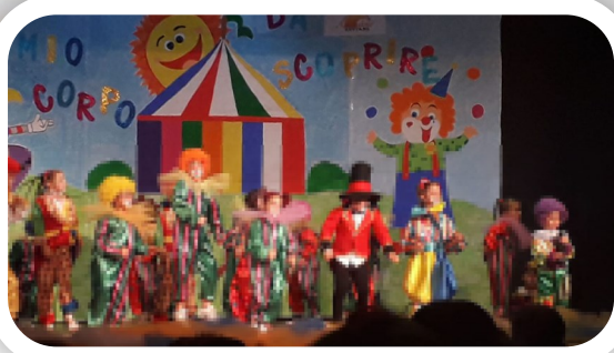
Festa di Carnevale

attraverso il gioco e le attività quotidiane si cercherà di far acquisire ai bambini la capacità di dialogare, raccontare ed esprimersi in lingua italiana.