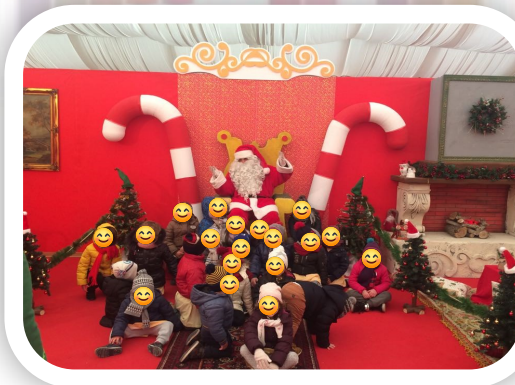
Visita al Villaggio di Babbo Natale

Gli ambienti della Scuola dell'Infanzia sono puliti, accoglienti, sicuri ed accessibili ai piccoli utenti. Le condizioni di igiene e sicurezza dei locali, dei servizi e delle attrezzature garantiscono una permanenza confortevole e sicura per i bambini e per il personale il quale provvede alla costante igiene dei servizi.