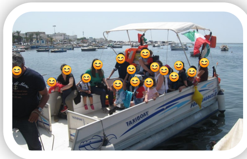
Visita all'Isola dei Conigli

Lo spazio esterno alla sezione (salone) utilizzato da tutti gli alunni della Scuola dell'Infanzia, costituisce occasione per svolgere attività comuni, finalizzate alla promozione di processi di integrazione tra bambini della Sezione Primavera e alunni della Scuola dell'Infanzia. Il salone è utilizzato anche per la comunicazione con le famiglie, attraverso l'esposizione di avvisi, regolamento interno, ecc.