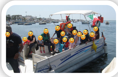
Visita all'Isola dei Conigli

Lo spazio esterno alla sezione (salone) utilizzato da tutti gli alunni della Scuola dell'Infanzia, costituisce occasione per svolgere attività comuni, finalizzate alla promozione di processi di integrazione tra bambini della Sezione Primavera e alunni della Scuola dell'Infanzia. Il salone è utilizzato anche per la comunicazione con le famiglie, attraverso l'esposizione di avvisi, regolamento interno, ecc.