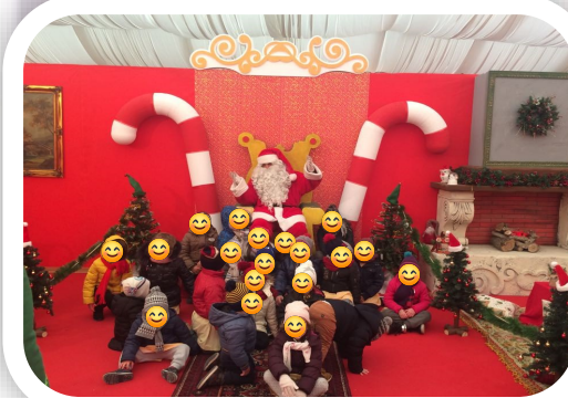
Visita al Villaggio di Babbo Natale

Gli ambienti della Scuola dell'Infanzia sono puliti, accoglienti, sicuri ed accessibili ai piccoli utenti. Le condizioni di igiene e sicurezza dei locali, dei servizi e delle attrezzature garantiscono una permanenza confortevole e sicura per i bambini e per il personale il quale provvede alla costante igiene dei servizi.